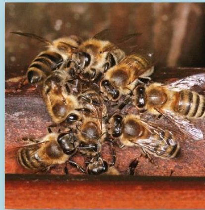
Abtasten von Neuankömmlingen