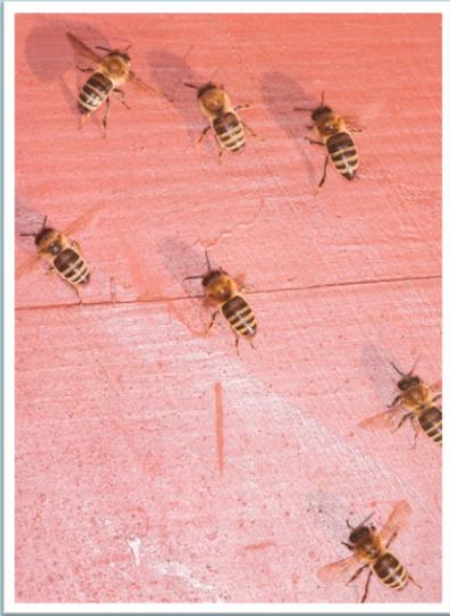
Ventilatorkette zum Luftaustausch